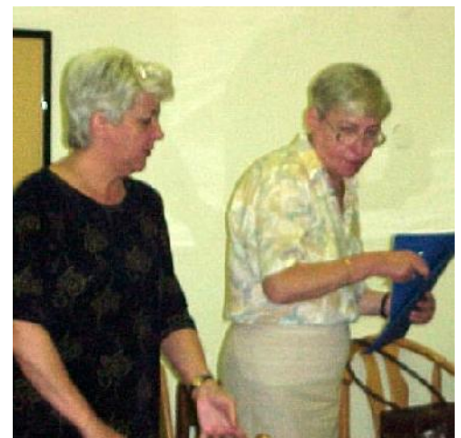
Immár tanárok nélkül