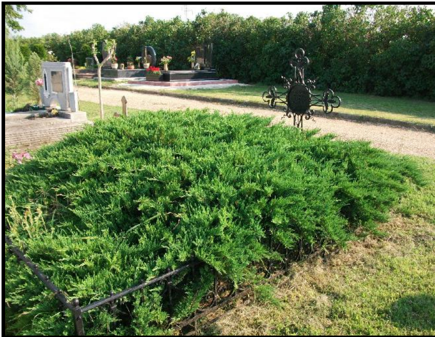
Tas tanár úr sírja a zamárdi temetőben (2010 évi felvétel).